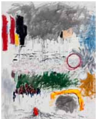
Oh, por favor, déjame entrar en la tormenta. 120 x 150 cm.