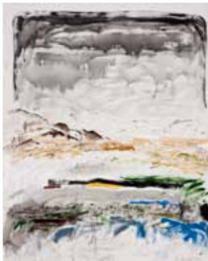
Iluminaciones, donde me convertía en una chispa transitoria. Mi patria es la intemperie. 120 x 150 cm.