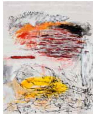
Mi eterno retorno. La contradicción nuestra de cada día. 120 x 150 cm.